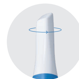
180° Punta Reversible

Tome el control total de su escaneo con solo hacer clic en un botón. ¡Sin necesidad de numerosos cables y concentradores! Simplemente conecte y escanee con un solo cable para la conexión directa con una PC.