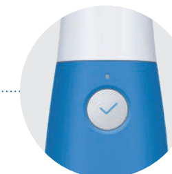
Botón de inicio de escaneo